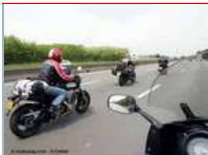
Rouler en groupe : les distances