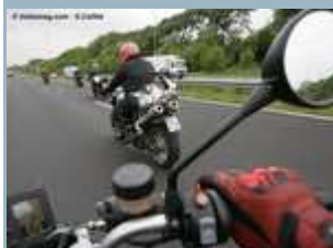
Rouler en groupe : protection et puissance