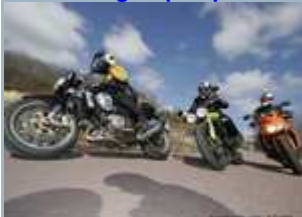
Rouler en groupe : pas d'imitation